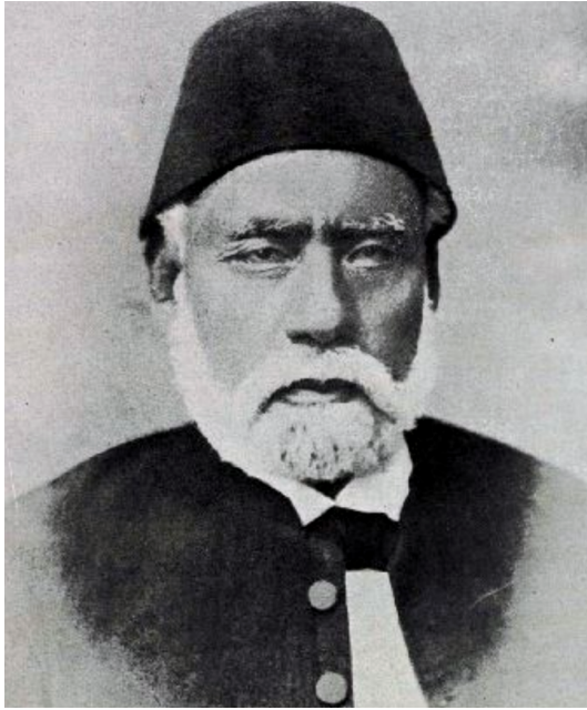
محمد سلطان باشا.